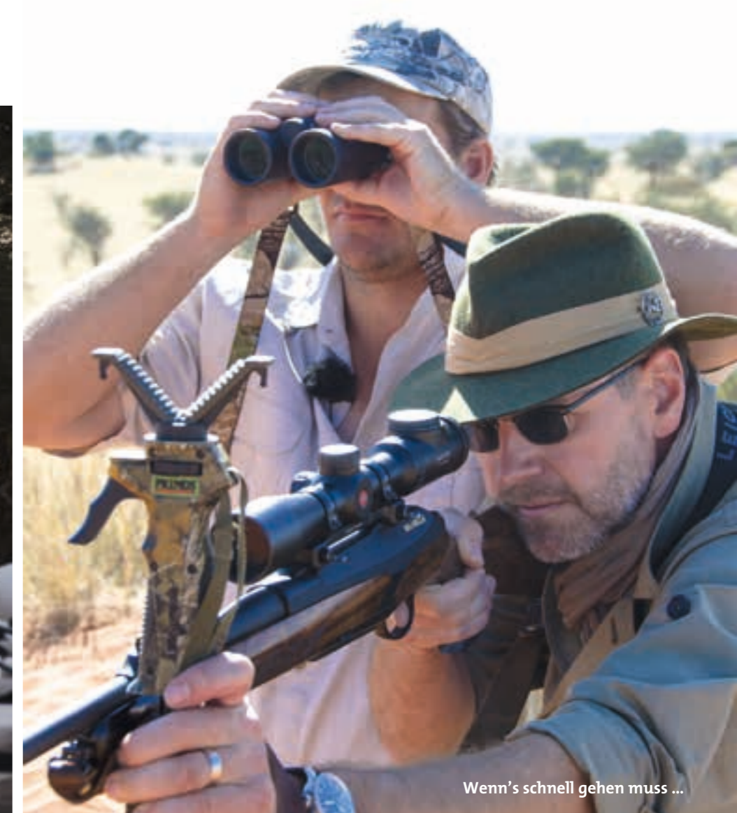
Wenn's schnell gehen muss ...