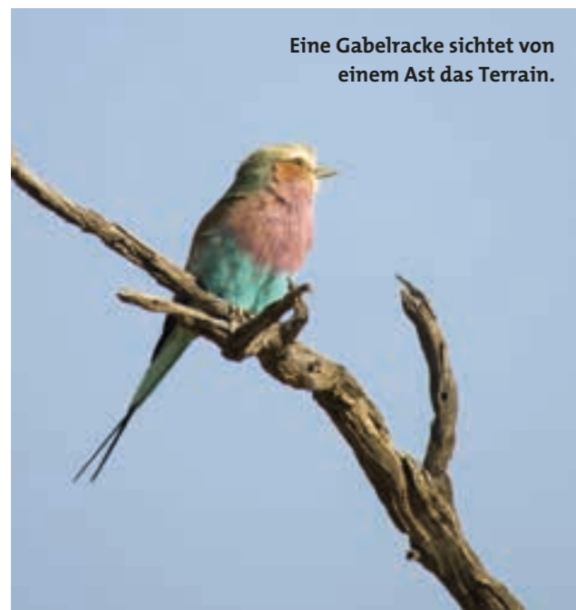
Eine Gabelracke sieht von einem Ast das Terrain.