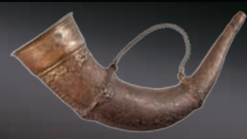
Sächsisches Jagdhorn im Stil der Renaissance, deutsch, 19. Jhdt.