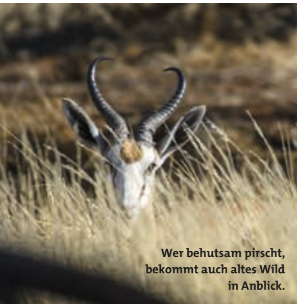
Wer behutsam pirscht, bekommt auch altes Wild in Anblick.