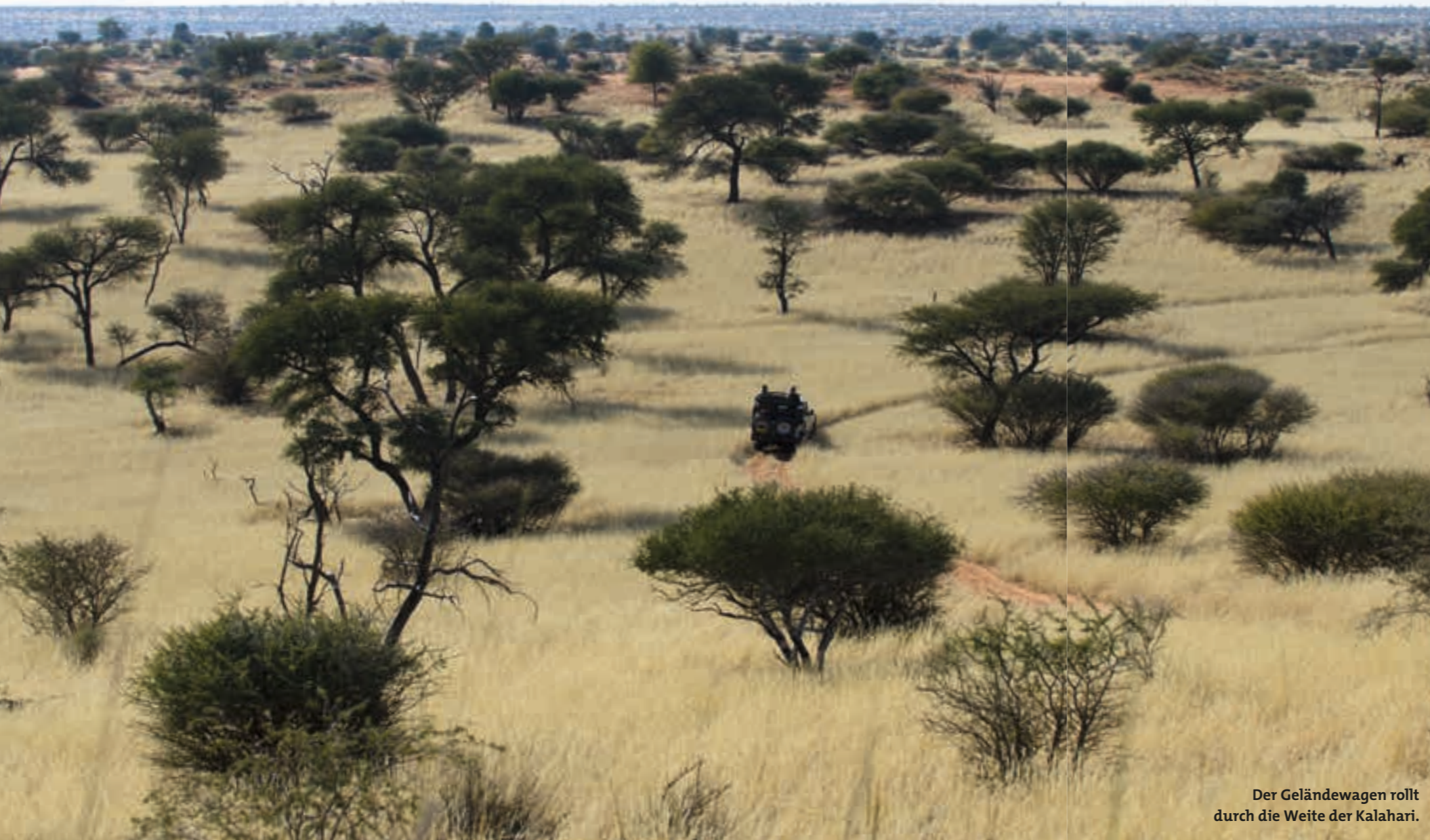
Der Geländewagen rollt durch die Weite der Kalahari.