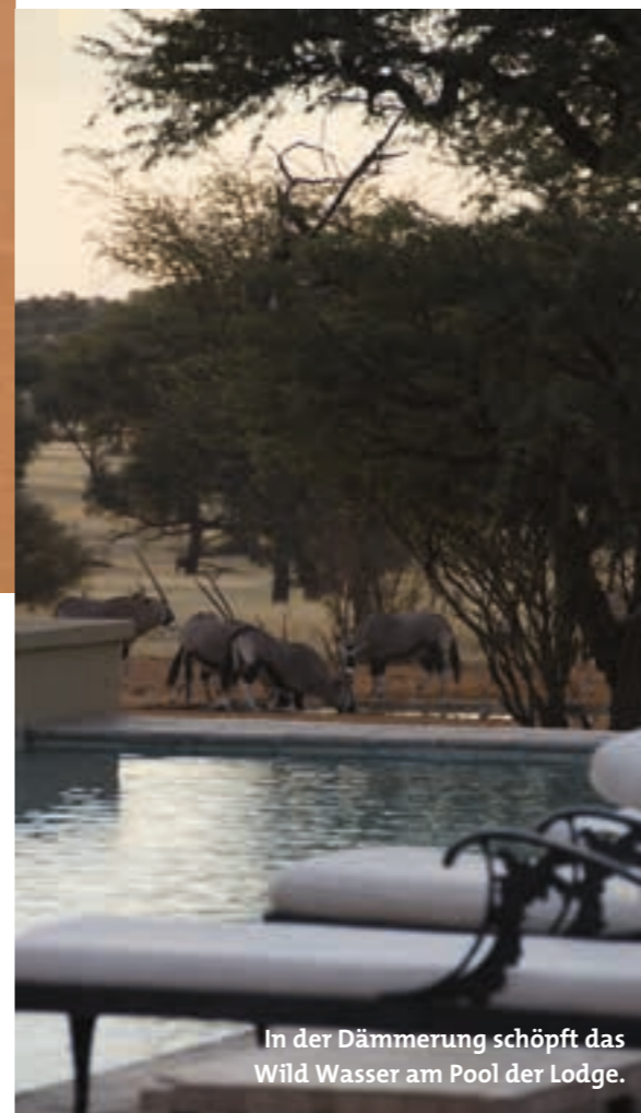
In der Dämmerung schöpft das Wild Wasser am Pool der Lodge.