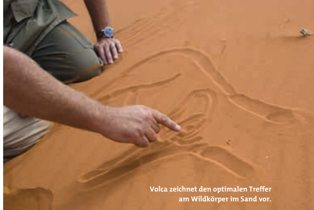
Volca zeichnet den optimalen Treffer am Wildkörper im Sand vor.