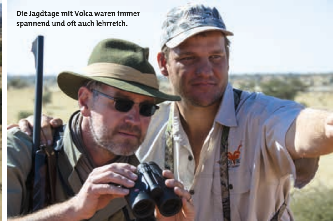
Die Jagdtage mit Volca waren immer spannend und oft auch lehrreich.