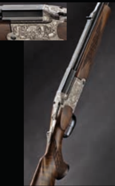
Großkaliber-Bergstutzen Blaser Mod. GB 860 Royal