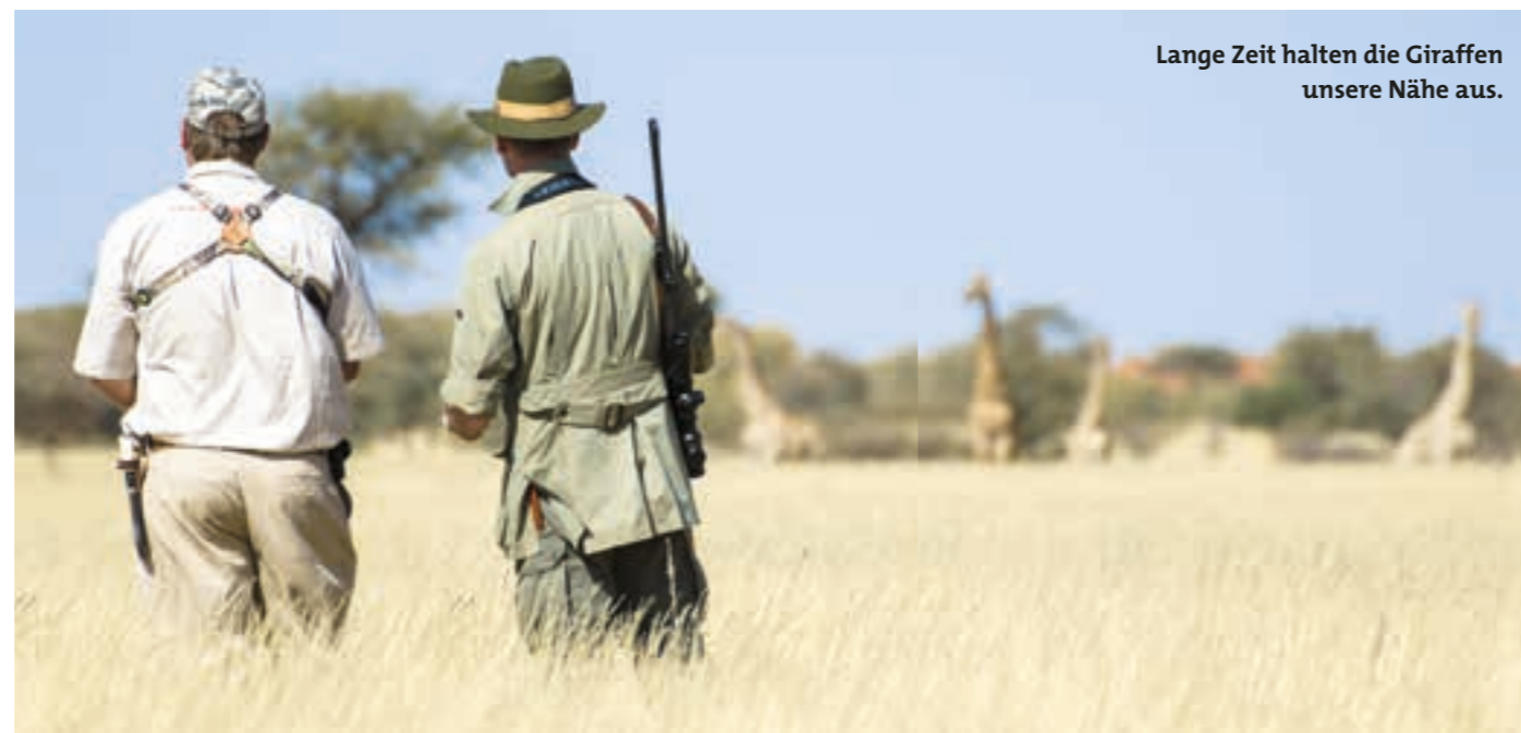
Lange Zeit halten die Giraffen unsere Nähe aus.