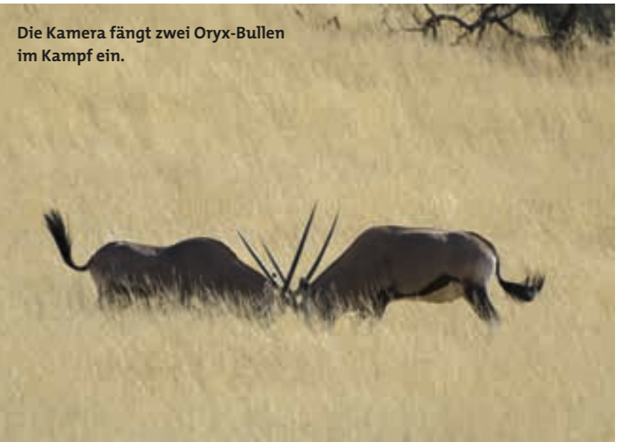
Die Kamera fängt zwei Oryx-Bullen im Kampf ein.

Von den Dünen aus hat man einen guten Überblick über die darunterliegenden Täler. Bäume und Sträucher geben Deckung.