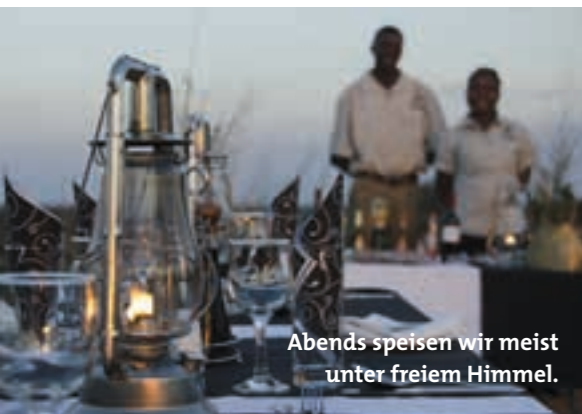
Abends speisen wir meist unter freiem Himmel.