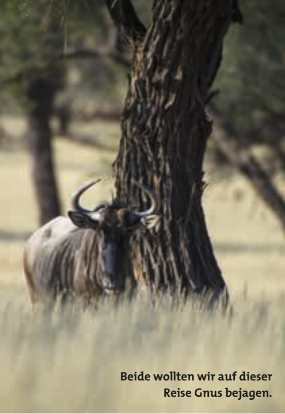
Beide wollten wir auf dieser Reise Gnus bejagen.