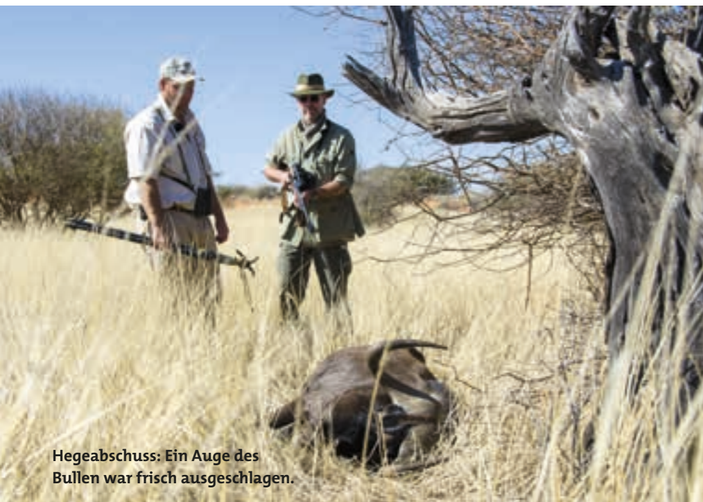
Hegeabschuss: Ein Auge des Bullen war frisch ausgeschlagen.

Für heute ist Hahn in Ruh, denn wir wollen die alte Farm besuchen, auf der die Mitarbeiter leben. Dort wird auch das Wild versorgt und weiterverarbeitet. Etwas abseits, außerhalb des Wildzauns, liegt diese Anlage, die trotz ihres offensichtlichen Alters gut in Schuss zu sein scheint. Diesen ersten Eindruck bestätigen Wildkammer und Schlachthaus, in denen die beiden Springböcke jetzt versorgt und zerlegt werden.