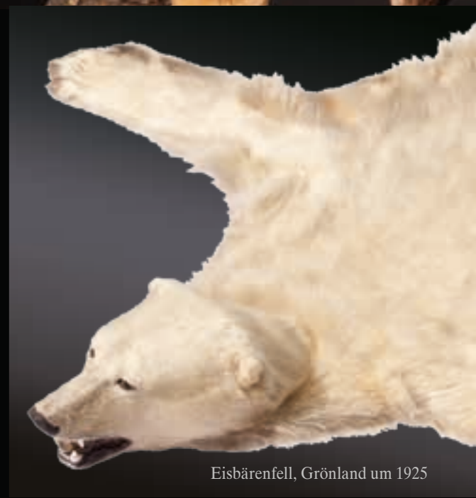
Eisbärenfell, Grönland um 1925